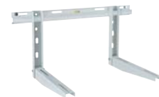
■ WBA Voorgemonteerde metalen muursteunen tot 250 kg