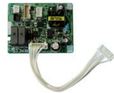
■ UTY-TWBXF Accessoires - Communicatiekit