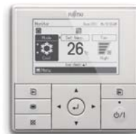
■ UTY-RVNYM Accessoires - Bedrade bediening