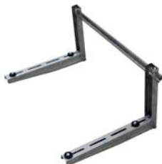
■ WBI Voorgemonteerde inox muursteunen tot 160 kg