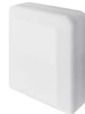
■ UTY-VKSX Accessoires - Individuele KNX converter