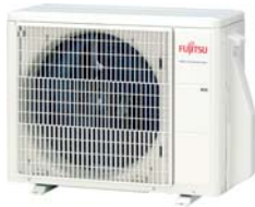
■ AOYG KMCC Inverter buitenunits Fujitsu