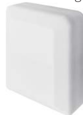
■ UTY-VMSX Accessoires - MODBUS Converter