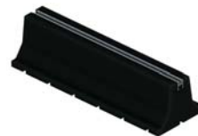
■ MPRH Trillingsabsorberende montageblokken hoogte 15 cm