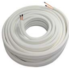
■ P-COIL Dubbele geïsoleerde koperen buizen